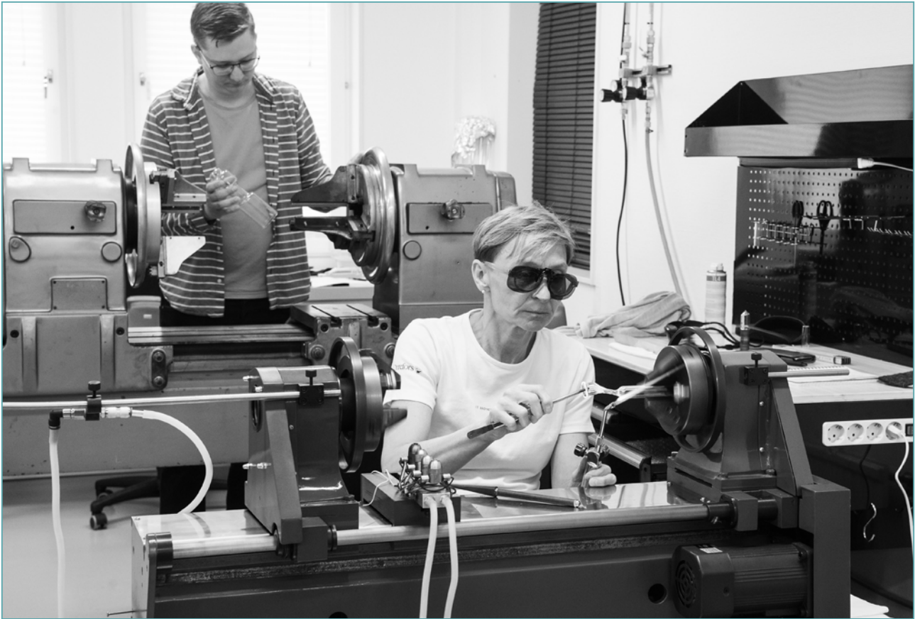
Ett viktigt moment i tillverkningen av röntgenrör är teknisk glasbläsning. I glassvarvarna läggs glas på metall (kovar) och glaskroppen formas till önskad längd och form.