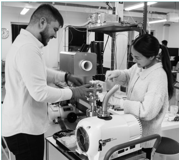
Luxbright använder sig av avancerad pumpsteknik i flera steg för att uppnå ultrahögt vakuum i röntgenrör.

Priset per röntgenrör varierar kraftigt och Bolaget har gjort bedömningen att röntgenrör kostar allt från cirka 100 EUR för röntgenrör som används i odontologiska applikationer till över 150 000 EUR för de allra dyraste röntgenrören som används i avancerade datortomografi (CT)-maskiner. Priserna på den typ av röntgenrör som Bolaget fokuserar på, vilket inkluderar olika typer av mikrofokusrör, varierar mellan cirka 1000 och 12 000 EUR. Om ett genomsnittspris på 3000 Euro antas innebär detta att bolagets adresserbara marknad för röntgenrör uppgår till cirka 690 MEUR.