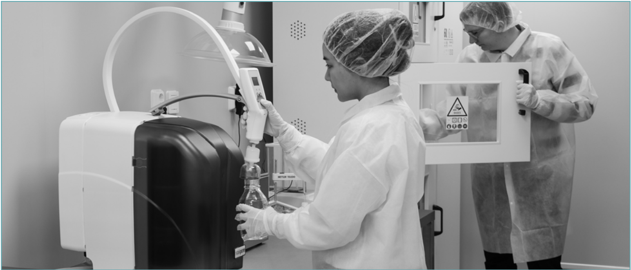
I Luxbrights lokaler i Västra Frölunda finns ett renrum ISO klass 7 installerat. För tillverkning av röntgenrör är det viktigt att alla delkomponenter hanteras på rätt sätt och att de kan rengöras med kemikalier, i olika steg, avpassat för varje processsteg.