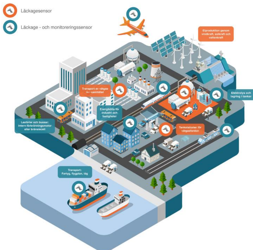
Bild 2: Behov av vätgassensorer för att optimera säkerhet och effektivitet i alla steg av vätgasens värdekedja.

Insplorions försäljning av mätinstrument sker i huvudsak genom distributörer. Bolaget har idag distributörsavtal med distributörer i Kina, Japan, Sydkorea, Storbritannien, Irland, Polen, Tyskland, Österrike, Portugal, Australien och Nya Zeeland.