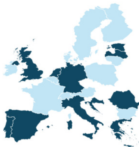
Bild 1. Visar de reglerade geografiska marknader där Bolaget har tillstånd och certifikat att bedriva verksamhet. Länder markerade i mörkblått representerar jurisdiktioner där Bolaget har erhållit specifika tillstånd och certifikat för dessa jurisdiktioner, länder markerade i ljusblått har Bolaget möjlighet att bedriva verksamhet genom erhållen MGA licens.

Gaming Corps har erhållit spellicenser och tillstånd för sin verksamhet från behöriga myndigheter i ett flertal jurisdiktioner, bland annat Grekland, Malta, Spanien, Storbritannien och Sverige. Bolaget erhöll även i december 2023 en ISO27001:2022-certifiering vilket är ett intyg på att Bolaget har infört ett väl fungerande system för att hantera risker relaterade till säkerheten för data som ägs eller hanteras av Bolaget.