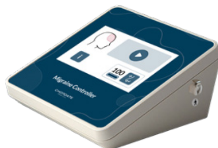
KONTROLLENHET Kontrollerar behandling Säkerställer att giltiga behandlingskoder används