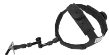
HEADBAND Hållare för bekväm applicering av kateter