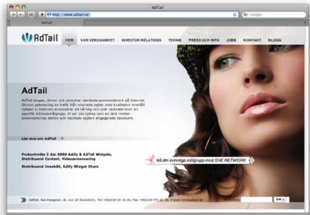
www.adtail.com smart vertikal annonsering på internet.

She Network har i sig utvecklat underkategorier som alla var för sig har stor potential.