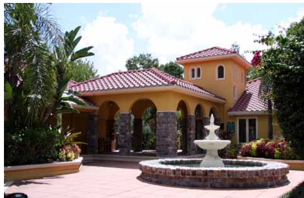
Vår första lägenhet ligger i det populära området Grande Oasis i norra delen av Tampa i Florida, USA.

Bostadsprojektet uppfördes mellan 1991-1993 och användes ursprungligen som hyresrätter för att senare omvandlas till ägarlägenheter. Många av dessa lägenheter såldes under den dåvarande högkonjunkturen och ända fram till krisen då det tog tvärstopp.