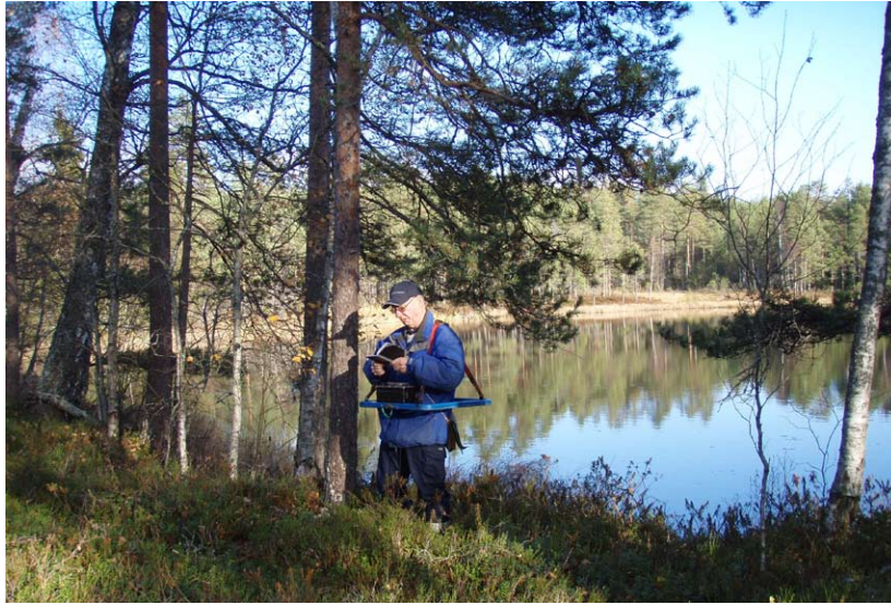
Pågående mätningar med slingram.

gare undersökningar krävs för att säkerställa resultatet. Bolaget planerar förtätad borrhning för att utvärdera potentialen.