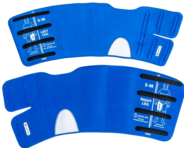
Bolagets egen bild avseende s.k. engångskylplattor till produkten BrainCool™ System som appliceras på den kroppsdel som ska kylas.

Sjukdomstillstånd som innebär känselbortfall i händer och fötter som en följd av cellgiftsbehandling.