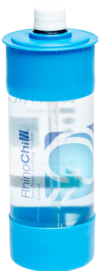
Bolagets egen bild avseende kylvätska till produkten RhinoChill™.

leverantörer eller andra parter, enligt vilka några ledande befattningshavare eller styrelseledamöter tillsats.