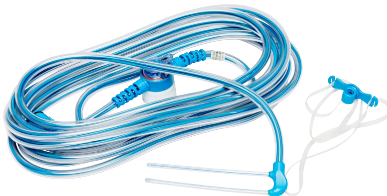
Bolagets egen bild avseende katetrar till produkten RhinoChill® System.

Inom onkologi har Bolaget utfört en nordisk klinisk studie om 180 patienter vilken publicerades i slutet av 2021. Studien ligger till grund för kommande lansering av produkten av och Cooral® System.