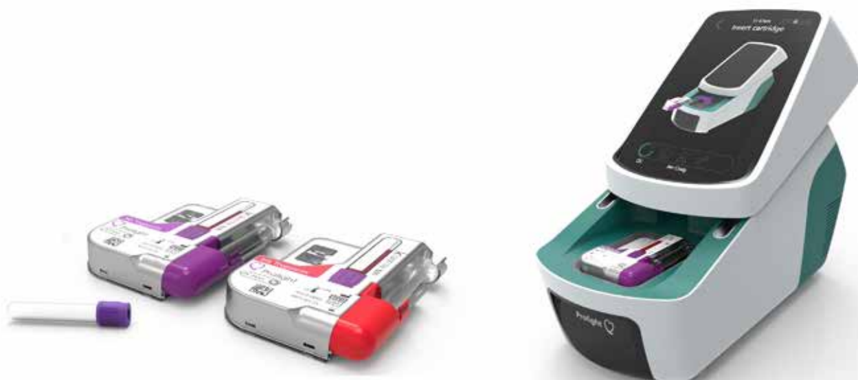
Bilderna visar exempel på hur testkort och instrument kan komma att se ut.