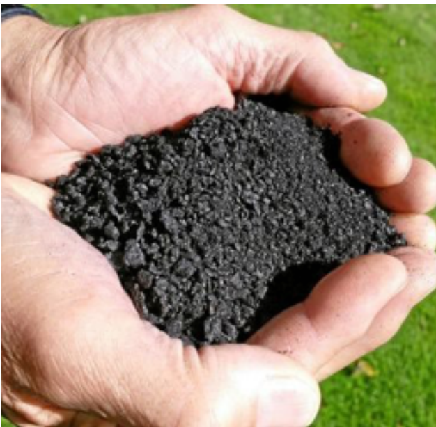
Biokol är det nya guldet.