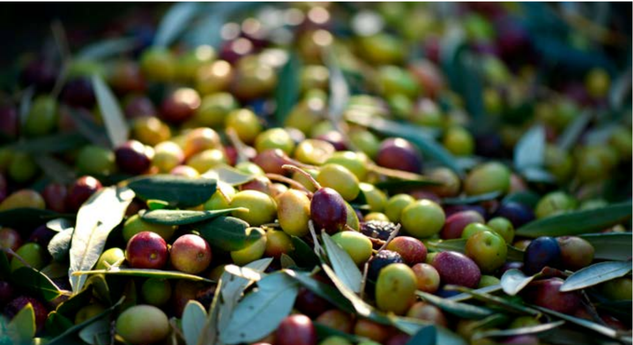
Grekland är en stor producent av oliver och restprodukterna lämpar sig väl att förgasa, vilket innebär produktion av el, biokol och varmvatten.

Zazz Energy är ett framtidsinriktat bolag inom energibranschen vars tekniska lösningar omvandlar biomassa/avfall till hållbar energi och biokol. Med vår metod för att hantera biomassa/avfall minskas utsläppen drastiskt samtidigt som vi producerar grön el och varmvatten.