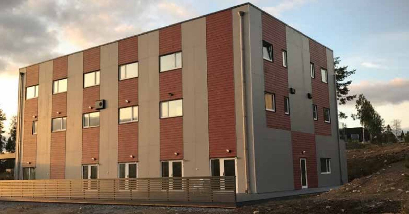
LSS-boende i Kallfors, Södertälje uppförd 2017.