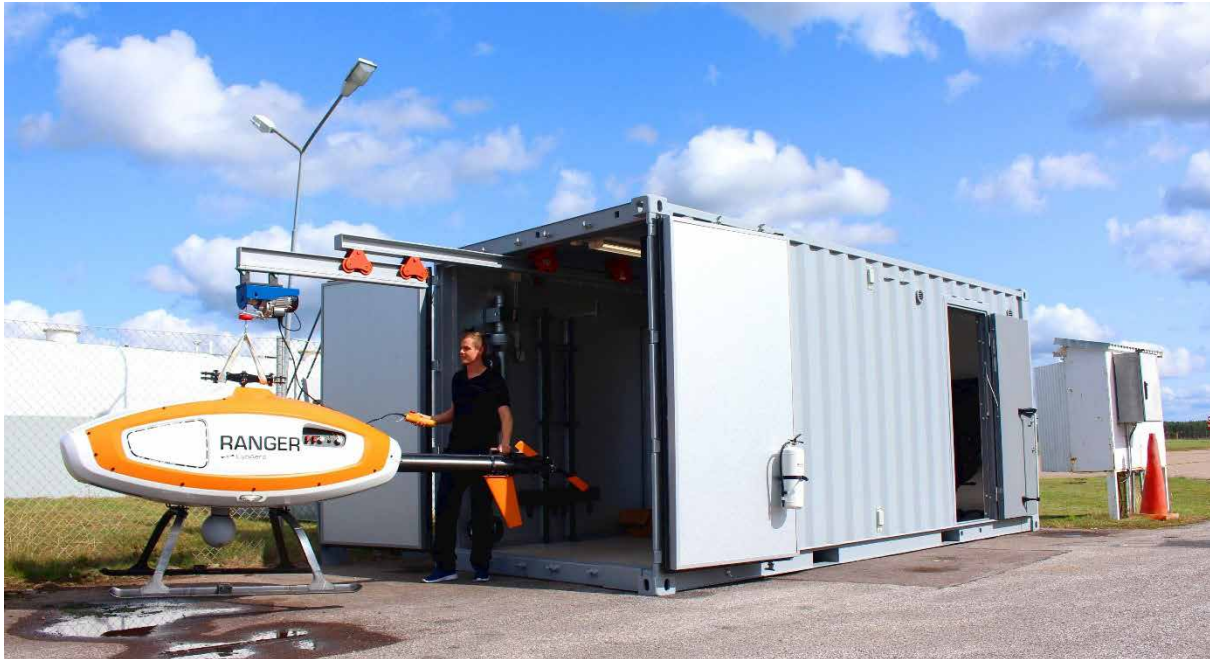
CybAeros APID One tillsammans med containerlösningen M.O.C. Mobile Operations Center man tagit fram

operatörer. I systemet finns även möjlighet till förvaring av två APID One-helikoptrar. Systemet levereras med bränsle driven generator för att kunna verka i områden där elnät inte finns att tillgå och en tio meter hög mast för att kunna ge bättre länktäckning. Allt detta är paketerat i en 20-fots standardcontainer som klarar tuffa väderförhållanden vilket gör detta till en helhetslösning för lyckade uppdrag.