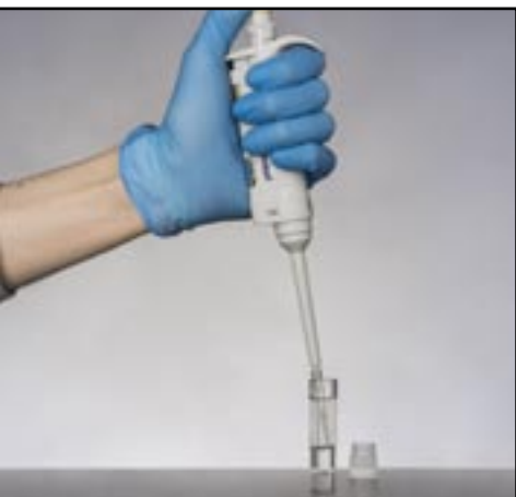
European Institute of Science ABs patientnära (POC) blodmätning av hund-CRP.

"Anledningen till att just denna applikation har valts är den stora globala marknadspotentialen som uppgår till 500 MSEK per år." (hänvisning sida 2)