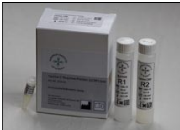
European Institute of Science AB har tillsammans med DiaSystem Scandinavia AB utvecklat veterinära reagens för automatiska analysatorer. På bilden syns reagens för inflammationsmarkören hund-CRP.

Bolaget har även slutit ett joint venture avtal med bolaget DiaSystem Scandinavia AB ( www.diasystem.se ) som är verksam inom produktion och försäljning inom klinisk kemi, hematologi, immunologi samt blodcellsavbildning, med produkter såsom bland annat automatiska analysatorer, reagens, kontroller, IT samt instrument service. Joint venture avtalet omfattar en gemensam produktion samt kommersialisering av reagens, standarder samt kontroller, för detektion av inflammationsmarkörerna CRP hos hund samt SAA hos häst. Dessa är enbart avsedda för veterinära applikationer på automatiska analysatorer. Produkterna kommer att säljas globalt under EURIS varumärke. Testet för CRP har redan utvecklats internt på EURIS och förväntas att efter en klinisk utvärdering släppas under år 2017 på veterinärmarkanden.