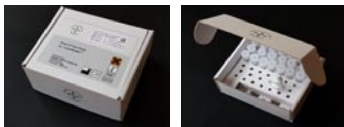
Bilden visar förpackning innehållande 20 stycken test för mätning av inflammationsproteinet C-reaktivt protein (cCRP) hos hund. Testen tillverkas av bolaget och är specialanpassade för användning med TurboReader™.

Instrumentet är kompakt för att inte ta upp onödig arbetsyta hos kunderna samt väger ca 1 kg. Det kräver inga extra kalibrerings- eller skötselprocedurer och är redan anpassat för internationellt bruk med en bred spänningsmatning (100-230 V och 50-60 Hz). Instrumentet är CE-märkt och uppfyller således EUs EMC-normer. Instrumentet har en datorkommunikationsport (RS232) för utskrift av data (skrivare finns som tillval) samt för tvåvägs dataöverföring (LIS). Vidare är instrumentet anpassat för fältbruk eftersom det även är batteridrivet (5 V).