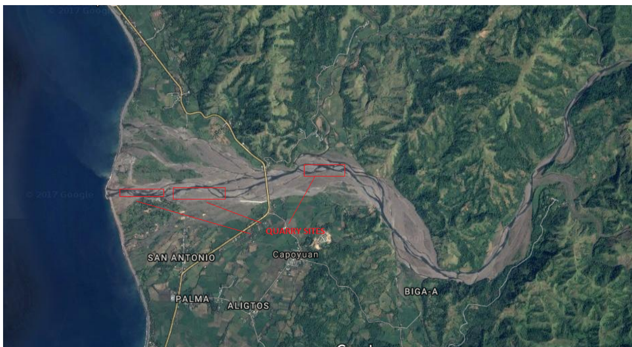
Flygvy av Antique

Bolaget tilldelades i april 2016 pris som Filippinernas bästa CSR-projekt (Corporate Social Responsibility) av medlemmarna i Nordic Business Council of the Philippines.