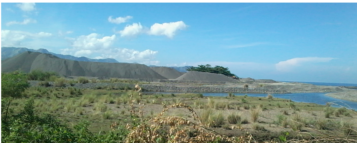
Stockpiles i Antique