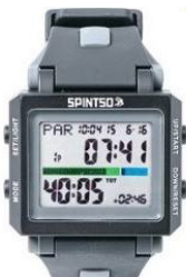
Spintso Ref Watch2S