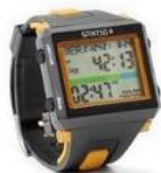
Spintso Ref Watch Pro