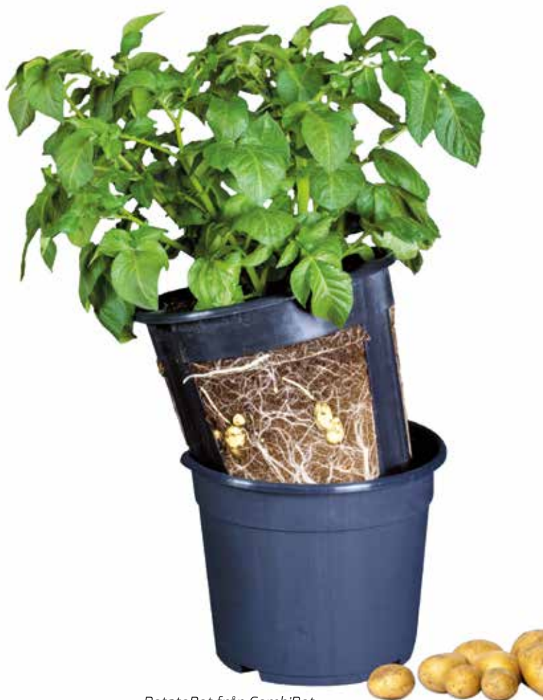
PotatoPot från CombiPot