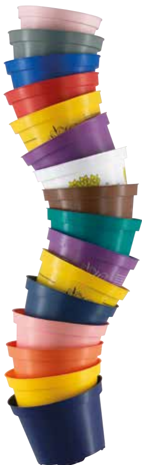
Plastkrukor från CombiPot