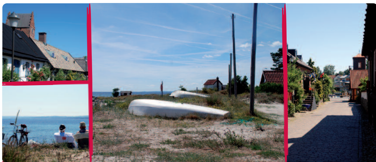
Cefour har sin bas i Åhus på den sydsvenska ostkusten

Marknadsinsatserna har i huvudsak varit riktade mot Skandinavien och Västeuropa och på senare tid även mot den amerikanska marknaden. Kostnaderna för marknadsinsatserna har främst finansierats genom ett antal emissionserbjudanden.