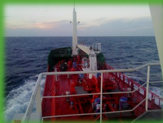
MT Pallas passerar Cypren på sin jungfruresa.