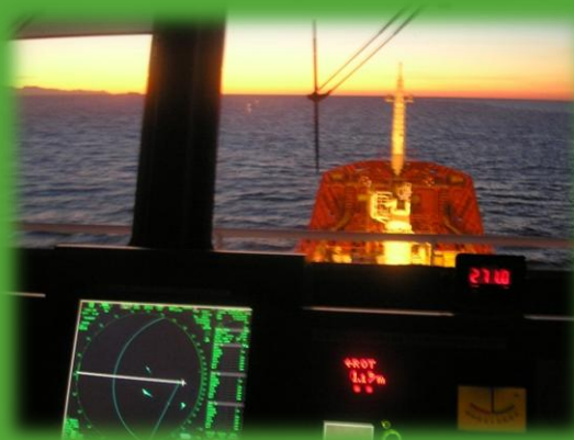
Pallas fartyg är utrustade med den senaste radartekniken samt med elektroniska sjökortssystem för säker navigering