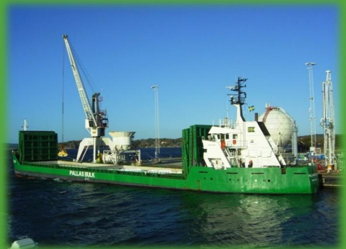
M/V Pallas Ocean lossar salt till Akzo Nobel i Stenungsund

Pallas Group har tidigare varit verksam också inom oljeinvesteringar samt kreditgivning. Dessa två verksamheter har bolaget beslutat att avyttra. Detta arbete pågår. Kvarvarande krediter samt andelar i oljebrunnar är en begränsad del av bolagets tillgångar.