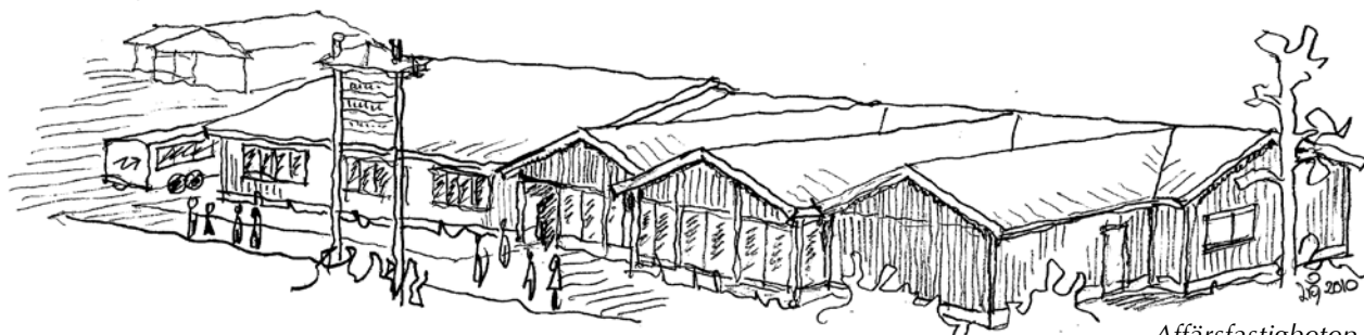
Affärsfastigheten i Älvdalen

” Porfyren är min sten. Att få tygla den handlar om att engagera alla sinnen. Varje bit ger inspiration. Dessutom är det stimulerande att arbeta med nyskapande och traditionsmedvetna formgivare. ”