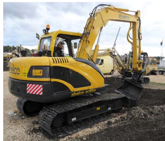
Tyngre grävare – xc85D

Minigrävarbranschen domineras av en handfull större aktörer och Abelco är bland de största och redan en av de mer välkända. Flera av de mindre bolagen närmar sig generationsskifte och många har en mycket liten försäljning varför mycket talar för att antalet fabrikat kommer att minska över tid. En konsolidering av branschen kan därför förväntas ske under de närmaste åren. Minigrävarmarknaden leds av andra aktörer än de för tyngre maskiner.