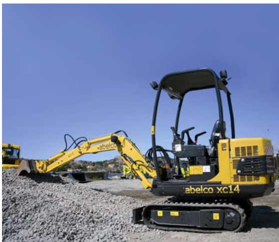
Minigrävare – xc14

Entreprenadbranschen växer, och förväntas hålla sig stabil enligt tillgängliga prognoser. Marknaden för minigrävare har sedan 2004 fram till 2007 vuxit med 50 procent, och uppgick då till cirka 800 enheter per år. År 2008 till 2009 var betydligt svagare år för