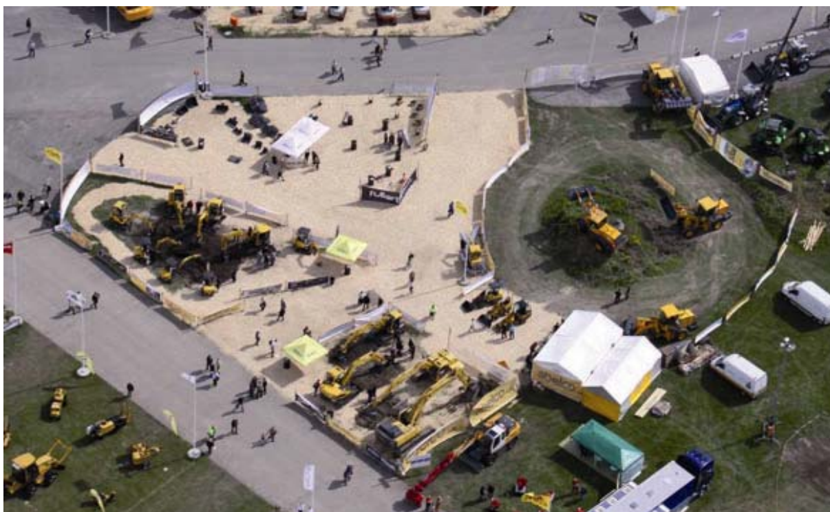
Abelco´s monter MaskinExpo 2010

Skulle nuvarande emission inte bli fulltecknad kommer bolaget att utvecklas i en långsammare takt än beräknat. Det kan innebära att försäljningsaktiviteterna kan komma att senareläggas och behov att genomföra ytterligare kapitalanskaffning genom nyemission kan föreligga, dock inte inom det närmaste året.