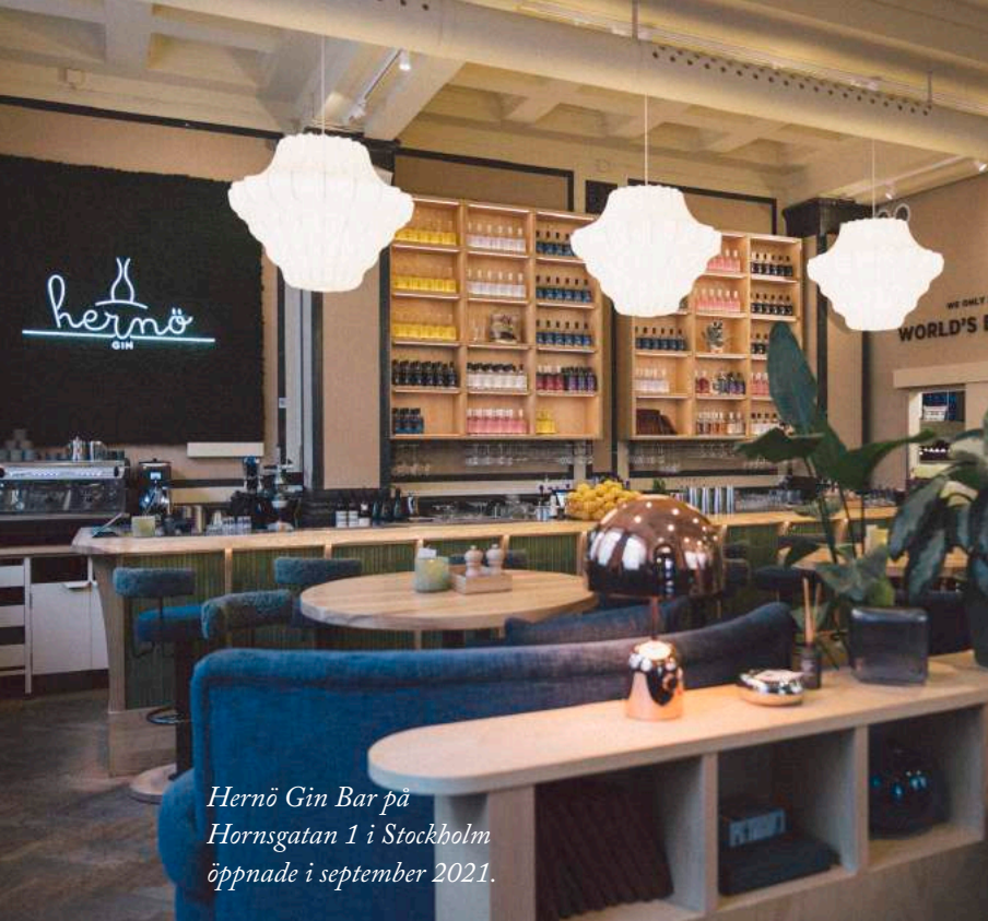
Hernö Gin Bar på Hornsgatan 1 i Stockholm öppnade i september 2021.