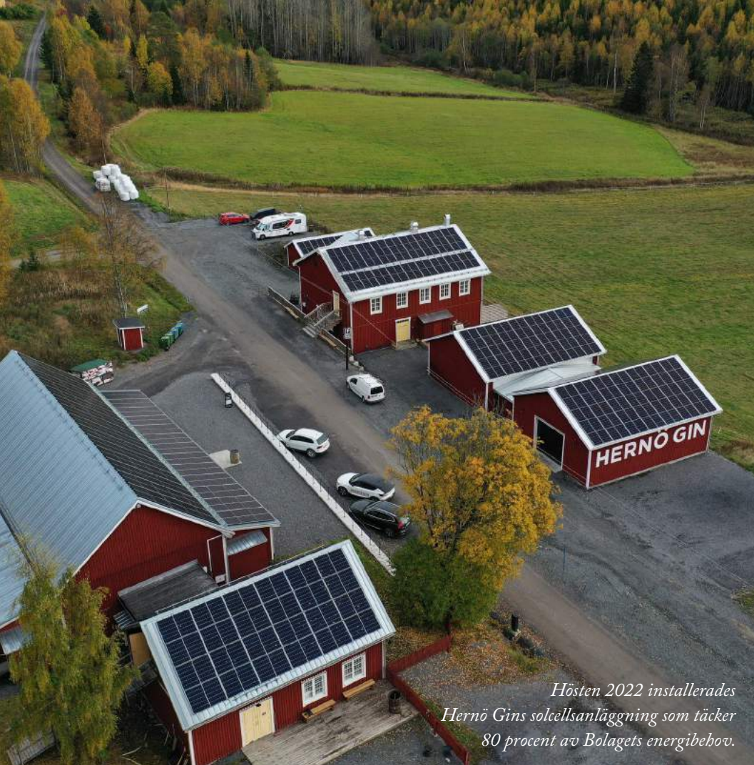
Hösten 2022 installerades Hernö Gins solcellsanläggning som täcker 80 procent av Bolagets energibehov.