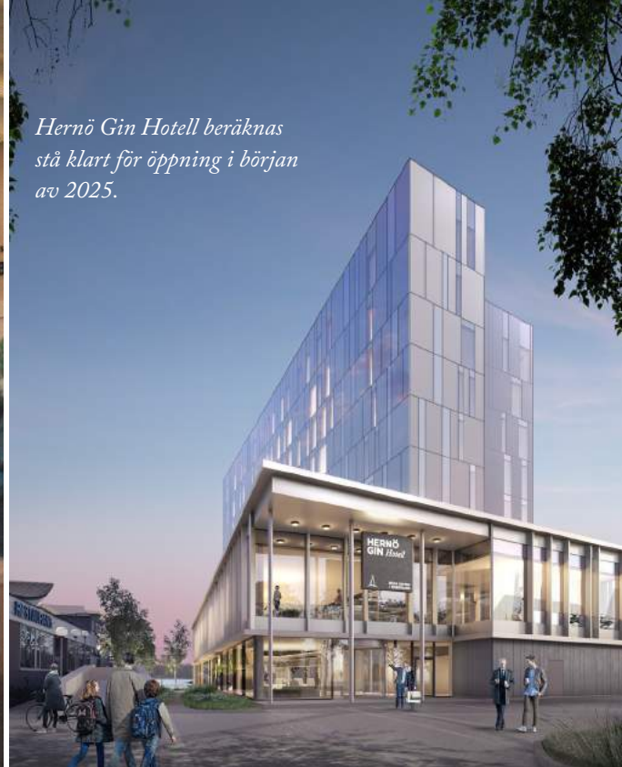
Hernö Gin Hotell beräknas stå klart för öppning i början av 2025.