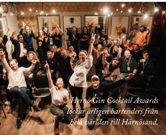
Hernö Gin Cocktail Awards lockar årligen bartenders från hela världen till Härnösand.