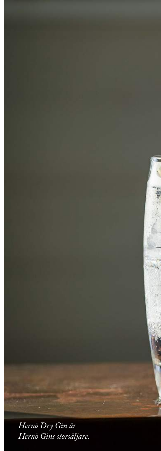
Hernö Dry Gin är Hernö Gins storsäljare.

Det svenska detaljhandelsmonopolet, Systembolaget, är det som främst skiljer Sverige från andra länder i EU som också tillverkar alkoholhaltiga drycker. Systembolaget har utfäst sig att lokala producenter skall erbjudas försäljning i de närmast be-