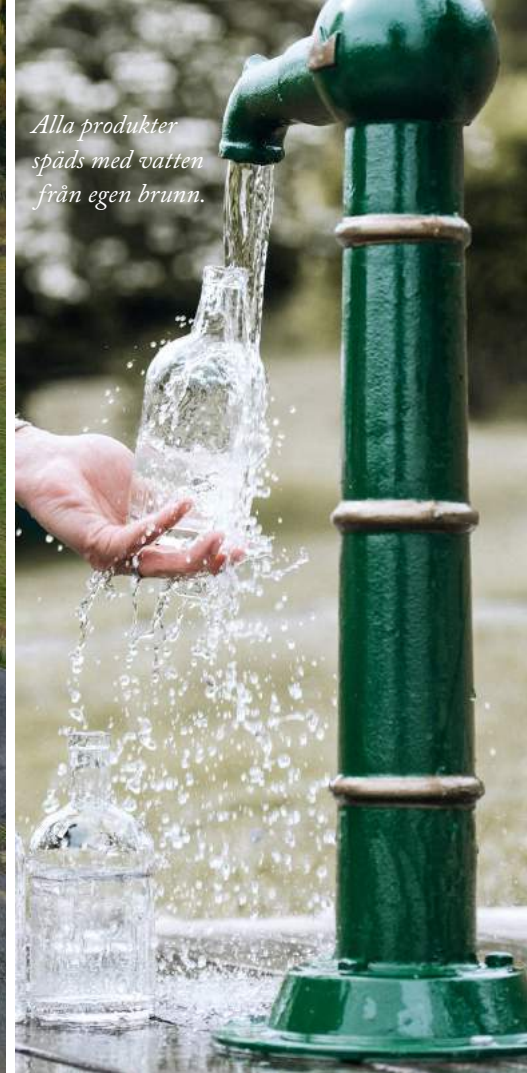
Alla produkter späds med vatten från egen brunn.

Hernö Gin jobbar för en så energieffektiv produktion som möjligt. Överskottsvärmen från kopparpannorna hjälper till att värma upp destilleriet och besökscentret. All inköpt el är uteslutande grön lokalproducerad energi från Härnösand Energi & Miljö AB (Hemab). 1